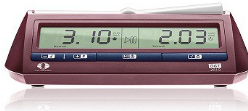
Obr.1 DGT 2010 - hnědá tlačítková lišta